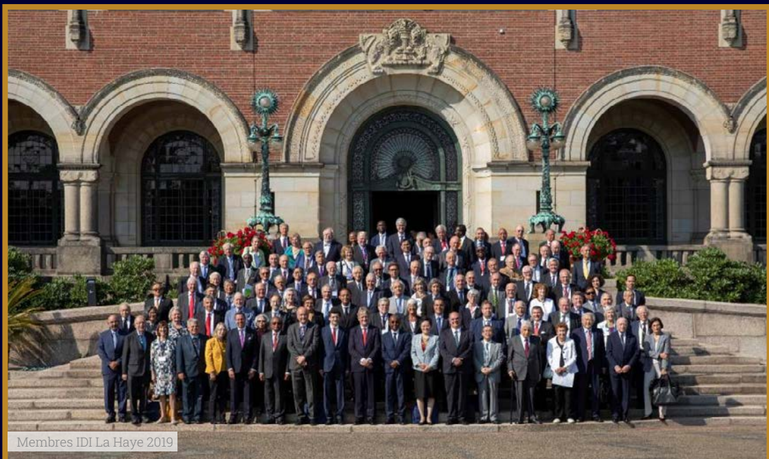
Membres IDI La Haye 2019

Session d'Angers 27 AOÛT - 3 SEPTEMBRE 2023