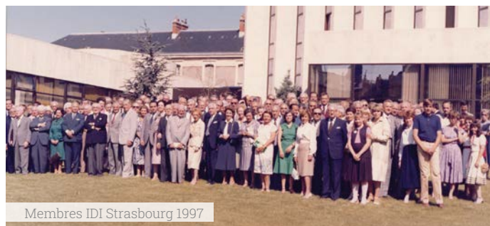
Membres IDI Strasbourg 1997