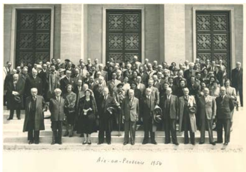
Membres IDI Aix-en-Provence 1954

Lors de sa dernière session en 2021 (organisée exceptionnellement en ligne), l'Institut a adopté des résolutions sur :